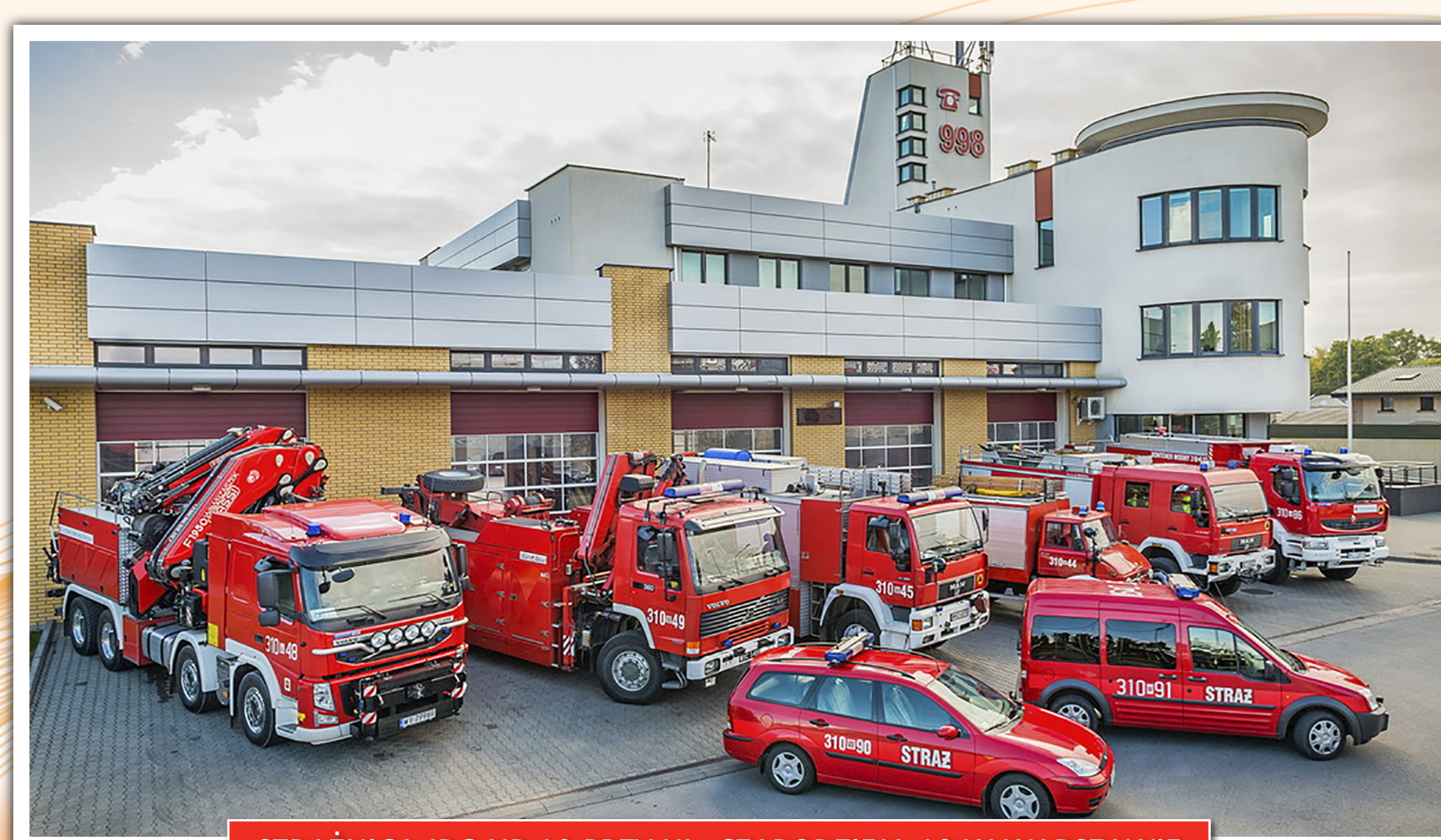
STRAŻNICA JRG NR 10 PRZY UL. CZARODZIEJA 19 W WARSZAWIE