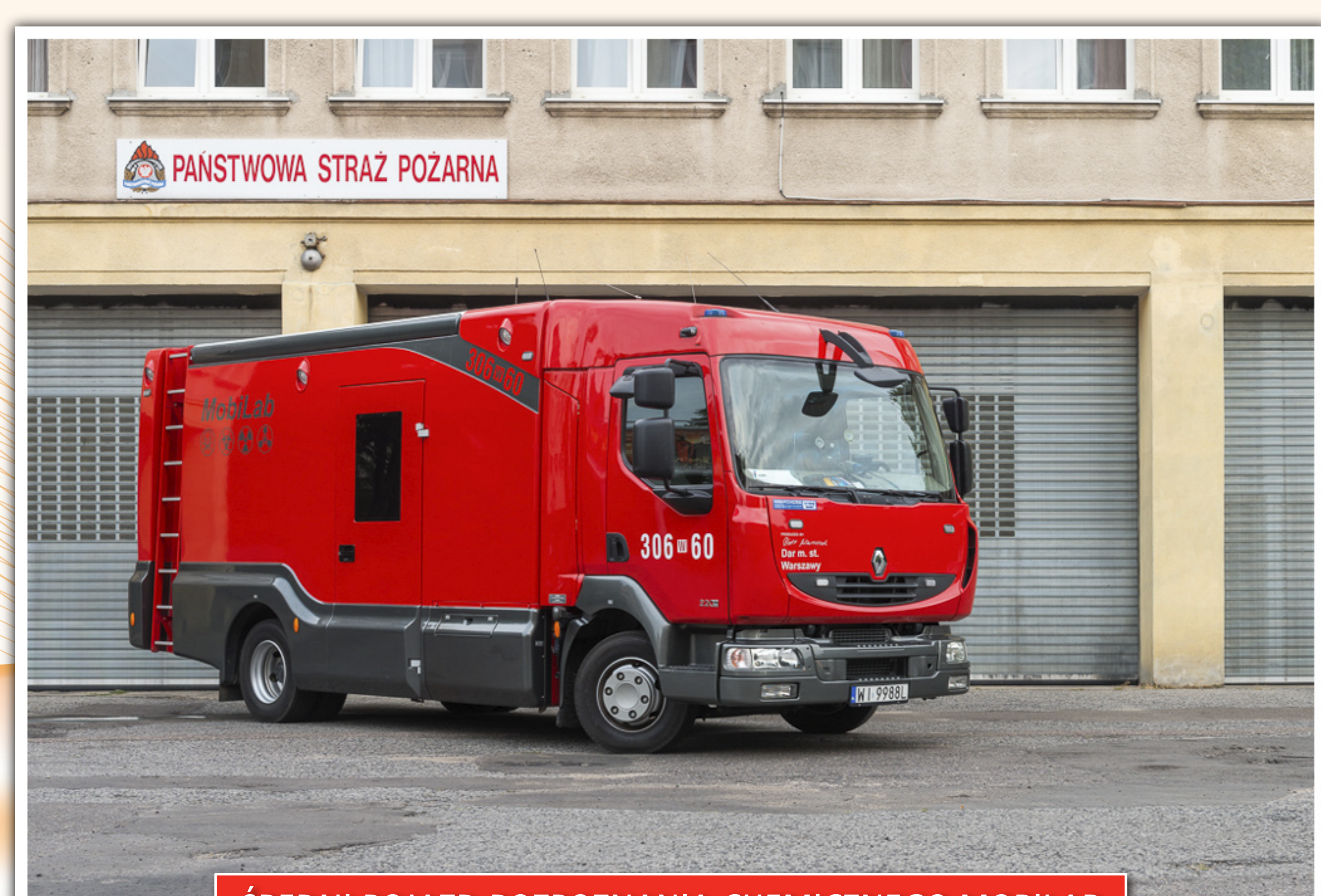
ŚREDNI POJAZD ROZPOZNANIA CHEMICZNEGO MOBILAB