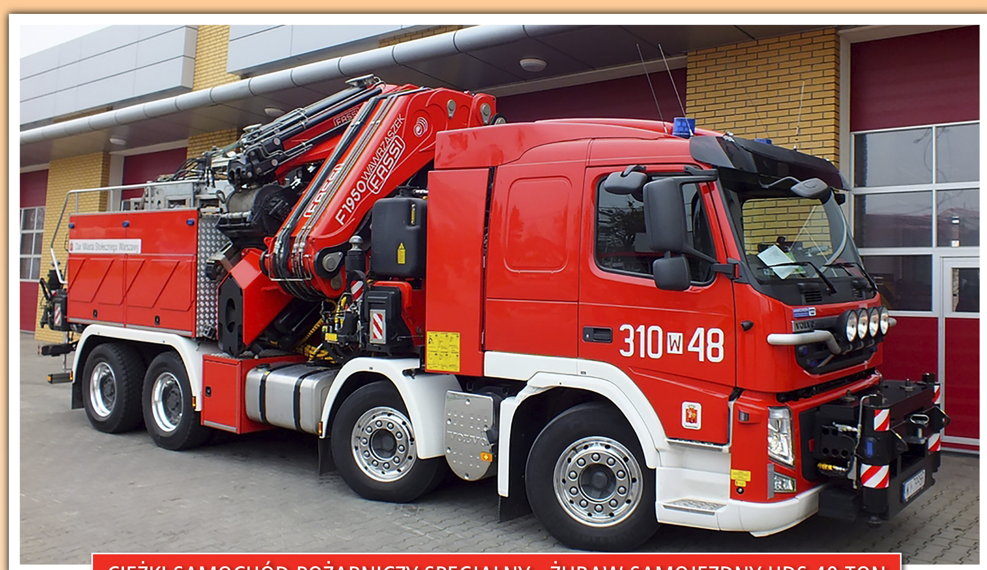
CIĘŻKI SAMOCHÓD POŻARNICZY SPECJALNY - ŻURAW SAMOJEZDNY HDS 40 TON